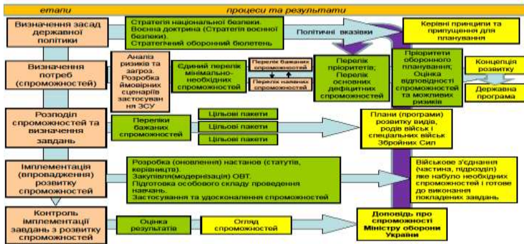
Рис. 3 Етапи оборонного планування