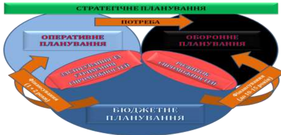
Рис. 2 Планування на основі спроможностей

на 10-15 років) (рис. 2). Більшість країн-членів НАТО впровадили або впроваджують цей метод оборонного планування [20, с. 1].